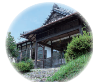
主な活動場所：黒川公民館

川西市黒川公民館で活動をスタートして3年が過ぎました。 水曜クラス”風”を新設し、そこに集う人がハッピーになる居場所を創っていきます。