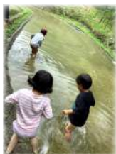
里山散策・里あそび