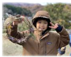
アトリエ (リース作り・木工・草木染め・手芸・工作など)